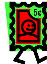
de filatelist op vakantie